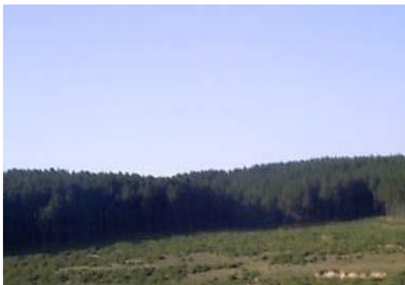
Zonë e rekreative në qytetin e Shtimes me sipërfaqe prej 15ha dhe sheshet ne qytetin e Shtimes