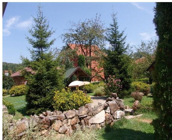
Restaurant "Trofta" në fshatin Petrovë