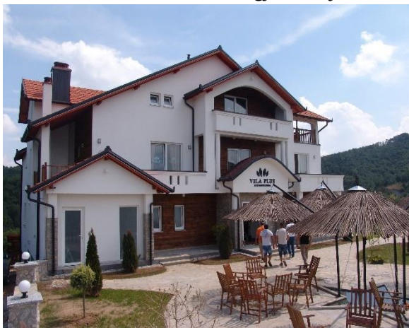
Restaurant & motel "Villa Plus" në fshatin Dugë