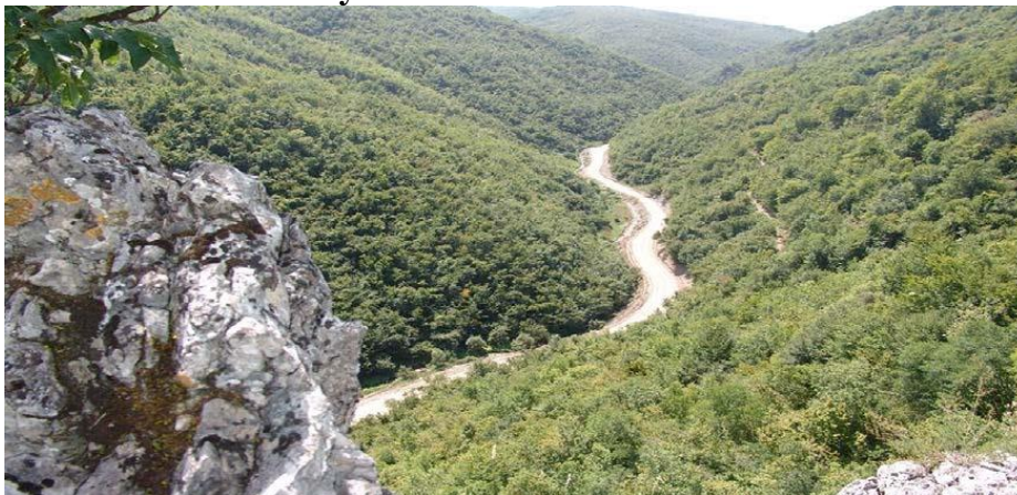
Pamje atraktive nga "Gryka e Llanishtit"

- Në mesin që ndan fshatrat Carralevë dhe Belinc rritet një lloj i veçantë i lules i cili quhet: "Lule Bozhur", po ashtu në këto dy fshatra rritet dhe kultivohet "Çaji i Malit"